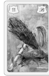
Nr. 11 Rute Ärger / Streit