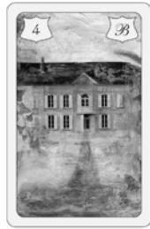
Nr. 4 Haus Häuslicher Bereich / Heim