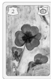
Nr. 4 Haus + Nr. 11 Rute + Nr. 2 Klee Häusl Bereich Streit Glück